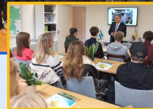
2021 Encuentros culturales con estudiantes