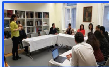
2019 Encuentro con colombianos adoptados en Suecia