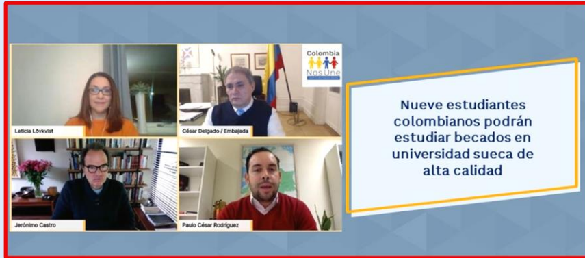
2021 Convenio de Cooperación Académica entre la Universidad de Jönköping y Colfuturo