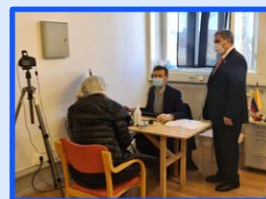
2021 Consulado Móvil en Malmö