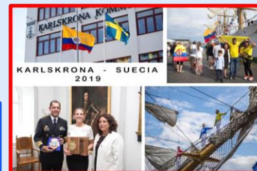
2019 Visita del Buque Gloria