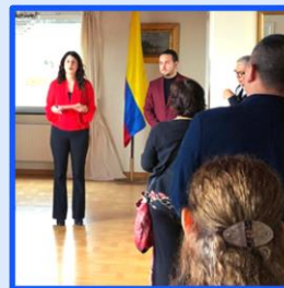
2020 Encuentro Consular