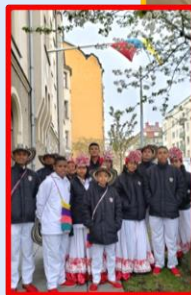
2019 Diplomacia Cultural y Deportiva

La Embajada ha promovido la cultura colombiana a través de la implementación del Plan de Promoción de Colombia en el Exterior, que ha incluido la presentación virtual de la Orquesta Sinfónica Nacional de Colombia; la realización de actividades literarias con escritores colombianos; la promoción de la gastronomía colombiana; la proyección de películas y documentales nacionales y sus directores ante diferentes auditorios; actividades académicas sobre historia, desarrollo urbano, medio ambiente entre otros. También a través de su acción cultural, la Embajada ha difundido a través de la plataforma Colombia Nos Une el Carnaval de Barranquilla con 1'200.000 reproducciones, el Festival del Bambuco con 11.000 reproducciones y la Feria de Cali con 18'148 reproducciones. Igualmente se han realizado múltiples encuentros con estudiantes suecos para promover la cultura de nuestro país.