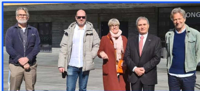
2021 Reunión con representantes de la Industria del Cine

Colombia se ha consolidado como socio comercial estratégico de Suecia en Latinoamérica. La Embajada con el apoyo de Procolombia ha llevado a cabo encuentros y eventos de promoción comercial en los que han participado empresas de diversos sectores como el farmacéutico, tecnología, industria, desarrollo rural, medio ambiente, energías renovables, fondos de inversiones, ciudades inteligentes, editorial, turismo, agro alimentos, interesados en invertir en Colombia o en importar insumos de nuestro país.