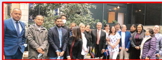
2021 Encuentro consular en Reikiavik -Islandia

A lo largo del 2021 la sección consular realizó diversas actividades virtuales y encuentros comunitarios dirigidos a los colombianos en Suecia e Islandia, en los que se abordaron asuntos como: Ley de Víctimas; normatividad vigente en materia de adopción y nacionalidad; comicios del 2022 y emprendimiento e inserción laboral en Suecia.