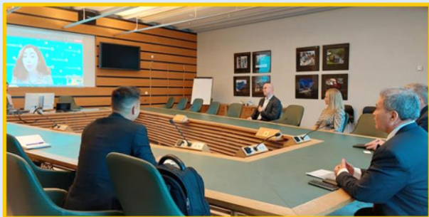
2021 Reunión con Scania