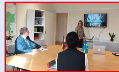
2021 Reunión con Ikea

En 2021 en el marco del programa Conectados, el Embajador se ha reunido con representantes de la industria del Cine del Sur de Suecia; CEOs, presidentes, vicepresidentes y altos representantes de importantes empresas como Ericsson, Essity, Scania, la Cámara de Comercio de Malmö; la Empresa AAK AB; Ikea y Swedish Game Industry .