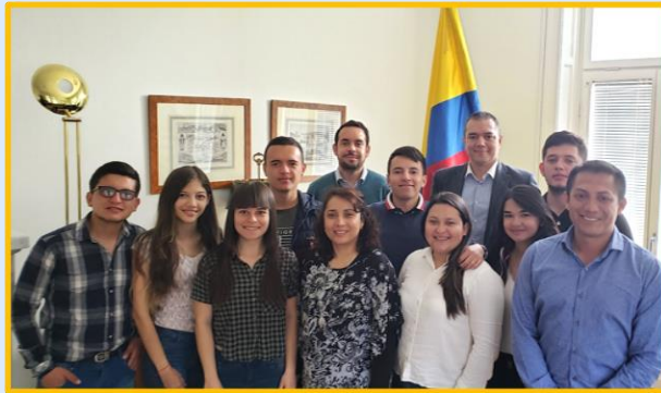
2019 Convenio KTH y Universidad del Cauca

La Embajada de Colombia en Suecia dialoga continuamente con universidades como KTH, la Universidad de Estocolmo, el Instituto Sueco, la Universidad de Malmö, la Universidad de Jönköping y la Universidad de Lund. Ha explorado oportunidades de capacitación, becas y movilidad académica para estudiantes colombianos. Entre algunas de las actividades promovidas se cuentan: