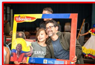
Jornada de Integración Cultural "Somos Colombia 2019"

En el 2020 en el marco de la emergencia sanitaria decretada por la pandemia, la sección consular prestó asistencia a 93 connacionales; gestionó la repatriación de 41 personas en vuelos humanitarios y entregó 19 bonos alimenticios a colombianos que quedaron en situación de vulnerabilidad.