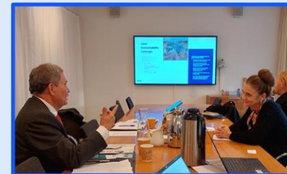
2021 Reunión con CEO DE NIR