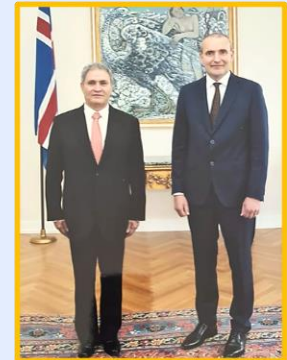
2021 Reunión con Presidente de Islandia