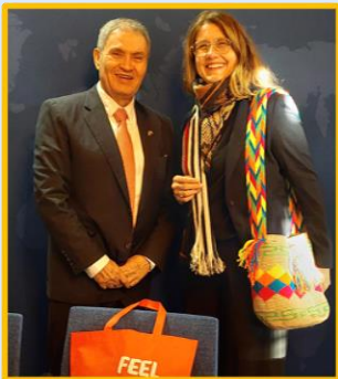
2021 Reunión con Viceministra de Cooperación al Desarrollo.

En 2021 se consiguió que Suecia extendiera su estrategia de cooperación al desarrollo con Colombia hasta el año 2025.