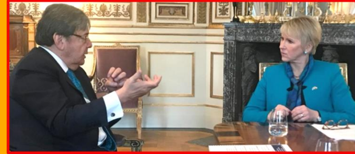
2019 Encuentro entre los Ministros de Relaciones Exteriores de Colombia y Suecia