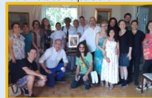
2019 Taller de Gastronomía Colombiana