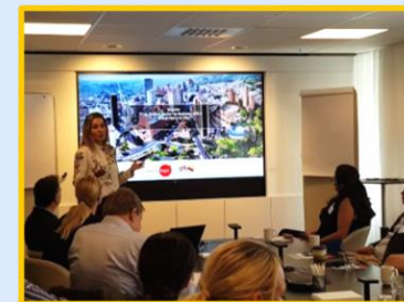
2019 Evento de Promoción Comercial